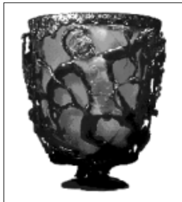
Figura 1. Taça de Licurgo: uma das mais famosas antiguidades romanas, data do século IV d.C. Fabricada com vidro contendo nanopartículas de ouro (7), pelos “velhos nanotecnologistas”. As partes escuras correspondem ao bronze e as claras onde se encontra o vidro ruby .

Pequenas partículas metálicas, dispersas no vidro, absorvem a luz e, desta maneira, podem apresentar cores vivas. Tal vidro é conhecido desde o século XVII (o que mostra que a nanotecnologia não é tão jovem!), sendo que o efeito ocasionado pela presença de partículas finamente divididas, em 1857, já fora reconhecido por Faraday (6). O tamanho das partículas de ouro (que, agora sabemos, são nanopartículas) influencia a absorção da luz. Partículas maiores que 20 nm de diâmetro deslocam a banda de absorção para comprimentos de onda maiores que 530 nm, ao passo que partículas menores geram um efeito contrário, ou seja: deslocam a absorção para menores comprimentos de onda. Assim, graças ao tamanho, é possível ter partículas com diferentes cores (laranja, púrpura, vermelho ou verdes), desde que seja capaz de controlar a distribuição do seu tamanho. A cor característica do vidro ruby é a vermelha, que corresponde a uma absorção de comprimento de onda por volta de 530 nm, logo com partículas da ordem de 20 nm. Neste exemplo fica evidente a questão das propriedades dependentes de tamanho, as quais, já assumindo o jargão da nanotecnologia, denominamos nanopartículas, pontos quânticos ( quantum dots ) ou nanopontos ( nanodots ) e o efeito, chamamos de efeito quântico de tamanho ( quantum size effect ). Na Figura 1, é apresentada a famosa peça romana, Taça de Licurgo, confeccionada com vidro ruby e bronze.